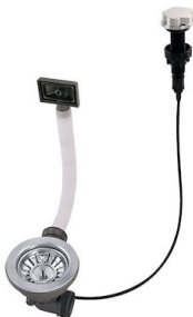
Desagüe automático 8407 100